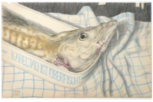
Kabeljau ist überfischt, 1.1.07, Blei- und Farbstift auf Atlaspapier, 28,5x44,5 cm,

Im Familienzentrum Rethen Braunschweiger Str.: 2D Eröffnung 11.5.2014 Ausstellung bis Ende Juni