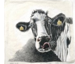
Ware Kuh, 20.5.11, Blei- und Farbstift, Himalayapapier, 47x48,5 cm,