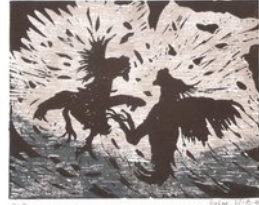
Hahnenkampf, 23.8.10, Linol- und Holzdruck, Auflage 7, 4 Probe, 21x26,5 auf Kupferdruckpapier 24,5x33 cm,