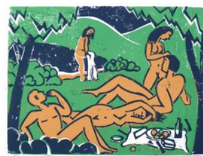
Im Grünen, 12.8.12, Linoldruck, Aufgabe 3, 3 Farben, 3 Platten, 29x38,5 cm, Bogen 31x41cm,