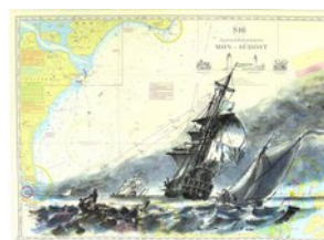
n. Bakhuizen, 10.2.13, Aquarell über Edding, auf Seekarte Mön-Südost, DIN A2Q,