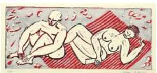
Paar auf rot-weißer Decke, 1.10.10, Linoldruck, Auflage 7, 4 Farben, eine Platte, 12,5x29 Bogen 12,5x32 cm,