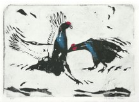
Birkhühner, 29.12.10, Linoldruck in 4 Farben auf Seidenpapier, Auflage 5, 21x30cm, Bogen 24,5x33 cm,