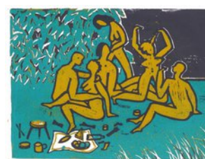
Das Bild mit dem X, 15.11.12, Linoldruck, Auflage 7, 3 Farben, 2 Platten, 28,5x39 cm, Bogen 32x42cm,