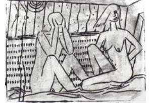
Abschied, 16.2.12, Linoliefdruck, Aufl. 9, 18+24cm, Bogen chin. Seidenpapier 27x32cm,