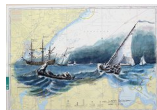
n. Bakhuizen, 15.3.13, Aquarell über Edding, auf Seekarte Lübecker Bucht, DIN A2Q,