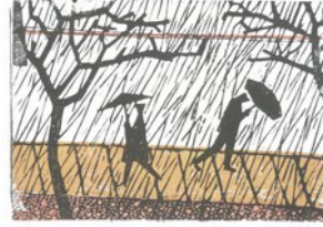
Vorbei, 23.1.11, Linoldruck, Aufgabe 7, 4 Farben auf schwarzer Grundplatte, Seidenpapier 21x30cm, Bogen 23x32 cm,