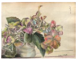
Hortensie, 25.10.08, Farbstift auf Atlaspapier, 28x37,5 cm,