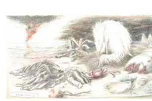
And the owner is ..., 7.6.10, Blei- und Farbstift, 30,5x56 cm,