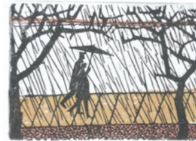
Paar, 13.2.11, Linoldruck, Aufgabe 7, 4 Farben auf schwarzer Grundplatte, Seidenpapier, 21x30cm, Bogen 23x33 cm,