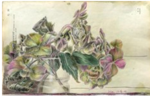
Hortensie, 27.10.08, Farbstift auf Atlaspapier, 28x44,5 cm,