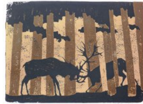
Brunft, 30.8.11, Linoldruck, Aufgabe 9, 2 Farben von einer Platte auf Schwarz, 20,5x28,5cm, Bogen 30x37 cm,