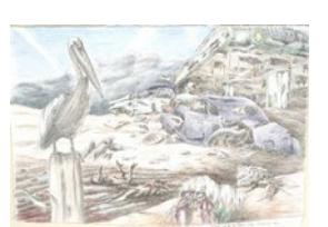
And the owner is ..., 20.6.10, Blei- und Farbstift, 38x57 cm,