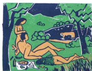
Im Grünen, 10.8.12, Linoldruck, Auflage 3, 1 AP, 3 Farben, 29x38,5 cm, Bogen 31x41 cm,