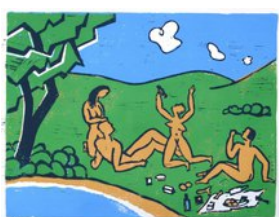
Im Grünen, 11.8.12, Linoldruck, Aufgabe 3, 4 Farben, 4 Platten, 29x38,5 cm, Bogen 31x41 cm,