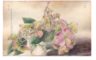
Hortensie, 22.10.08, Farbstift auf Atlaspapier, 28x44,5 cm,