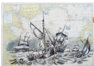
n. Bakhuizen, 12.4.13, Aquarell über Edding, auf Seekarte Kattegat Süd über Kopf, Gegenseite gleiche Scene, DIN A1Q,