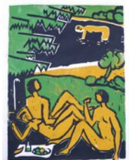
Im Grünen, 6.9.12, Linoldruck, Aufgabe 3, 3 Farben, 3 Platten, 26,5x20 cm, Bogen 32x24,5cm,