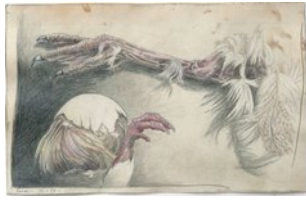
Entenbeine, 7.1.10, Blei- und Farbstift auf Atlaspapier, 28,5x44cm,