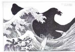
Surfen in ..., 5.1.13, Zeichnung, Edding, 70x100 cm,