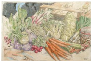
Gemüse, 14.5.09, Zeichnung auf Himalajapapier, 51,5x75cm,