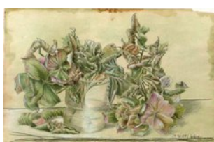
Hortensie, 31.10.08, Farbstift auf Atlaspapier, 28x44 cm,