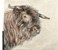
Stier, 25.2.10, Blei- und Farbstift auf Himalajapapier, 44,5x46,5 cm,